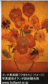
ゴッホ美術館「ひまわり」(イメージ)