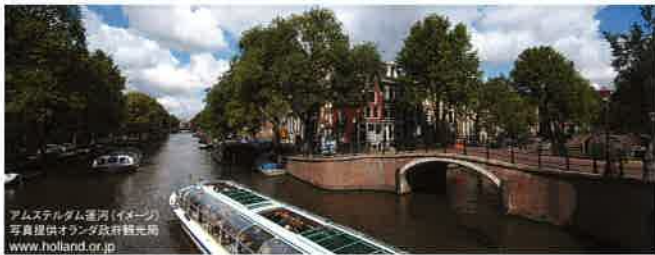
アムステルダム運河(イメージ)

謹啓 皆様にはご機嫌麗しくお過ごしのこととお慶び申し上げます。 今回の公益財団法人 日本舞踊振興財団の外国公演は、オランダで行います。前回のロシア公演にも増して内容の深い番組を提供する所存です。 皆様にも公演を鑑賞していただき、またオランダの美術館やベルギーの世界遺産に登録されている観光地等を訪ねる贅沢な旅行を計画いたしました。 そして私どもとともにランチ等をご一緒し、いつまでも思い出の残るようなツアーにしたいと考えております。 どうぞ一人でも多くの方の参加を賜りたくご案内申し上げます。