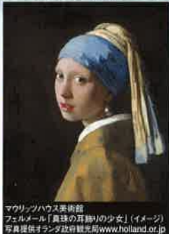
マウリッツハイス美術館 フェルメール「真珠の耳飾りの少女」(イメージ)